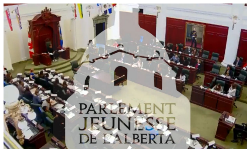
Parlement Jeunesse de l'Alberta 10-12e année - 5 au 8 mai