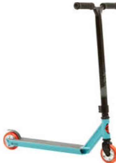
Trottinette acrobatique Décathlon turquoise