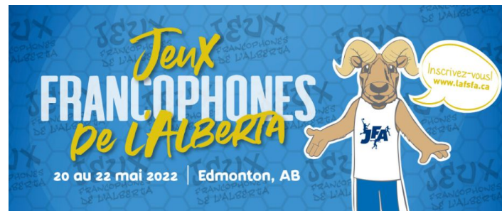
Jeux Francophones de l'Alberta du 20 au 22 mai