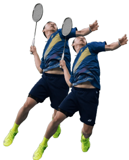
Tournoi de badminton à Edson le mardi 3 mai