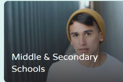
Middle & Secondary Schools