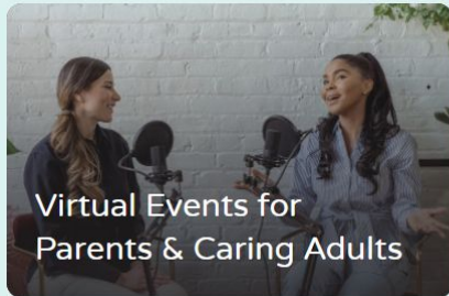
Virtual Events for Parents & Caring Adults

National Child & Youth Mental Health Day