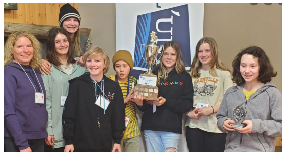
Festival Théâtre jeunesse de l'Alberta - du 21 au 24 avril