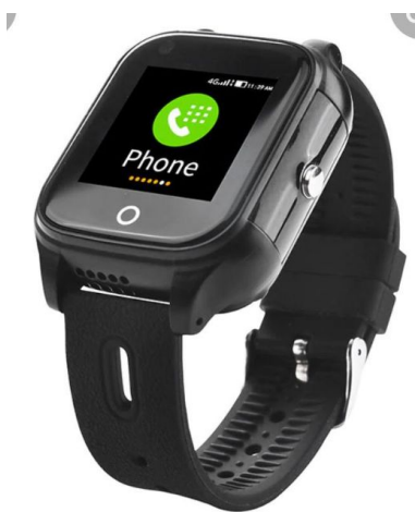
Apple watch - cadran épais

Deux de nos élèves ont récemment perdus des objets de valeur... Si jamais vous les trouvez ou vous les avez “empruntés”, s’il-vous-plait, simplement les retourner à l’école. Merci!